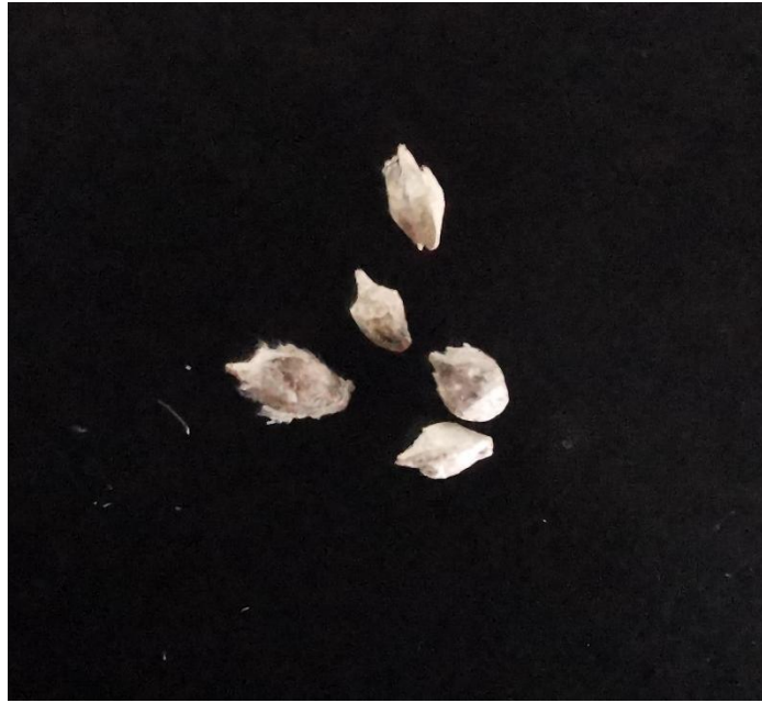
图 B.1 豚草果实